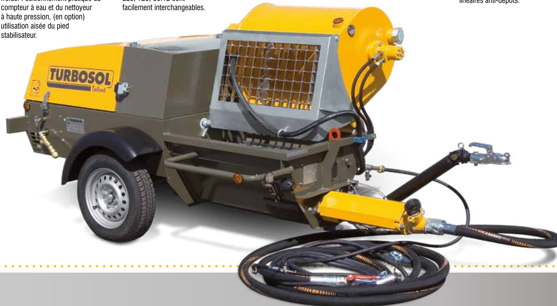
DIMENSIONS VERSION DM (cm)

Elle couvre une ample plage d'utilisations. Elle assure le rendement maximum en travaillant de grands volumes de matériaux grâce à la capacité du malaxeur, de la trémie et au débit de la pompe à vis. Grâce à son circuit hydraulique spécial Hydrotronic avec pompe à débit variable, elle optimise les prestations et permet d'économiser jusqu'à un litre de carburant par heure.